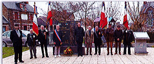
René Barre rend hommage au Soldat Inconnu à Paris

Aussi après la cérémonie devant le monument aux morts de Les Brulais, la même cérémonie s'est déroulée à Comblessac. Pour clore cette matinée commémorative, l'association des combattants de Les Brulais et de Comblessac a organisé un repas à Tréal pour la traditionnelle « tête de veau ».