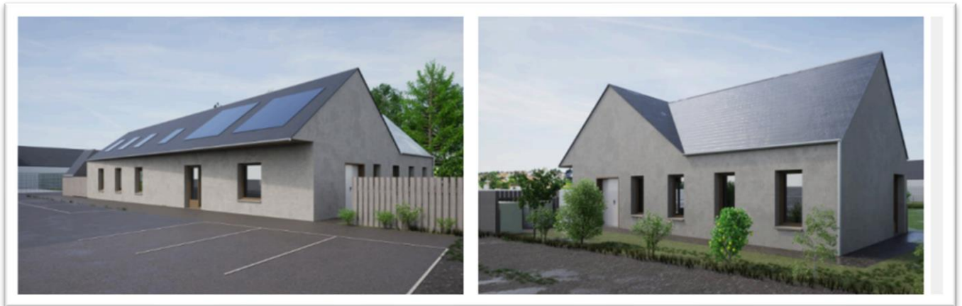
Insertion graphique de la future maison d'assistants maternels